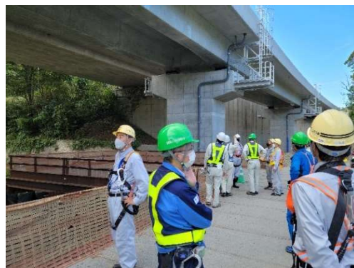
橋梁下面の状況 (神明第二橋)